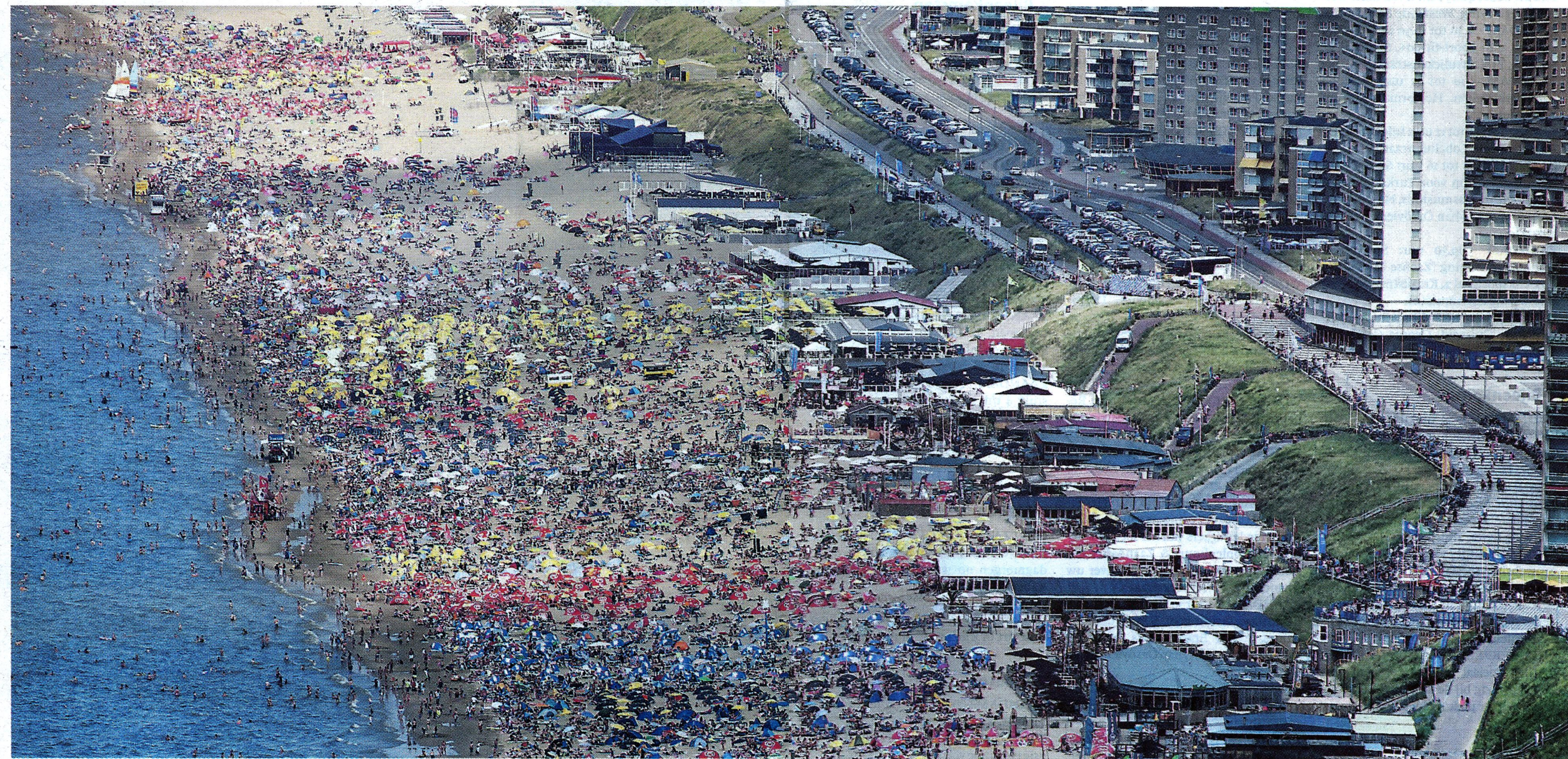
Luchtfoto van badgasten op het strand van Zandvoort.