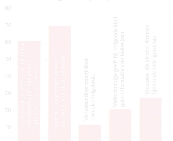
Onderzoek van Hogeschool Saxion