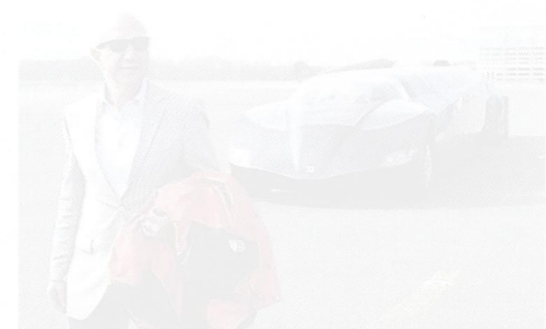
Wubbo Ockels.

Over de doden niets dan goeds, ook over Wubbo Ockels die zondag overleed en 68 jaar werd. In 1985 maakte hij als eerste Nederlander een vlucht door de ruimte te maken. De oud-astronaut was expert in technologische innovatie en duurzame energie. Kort voor zijn dood stelde hij een afscheidsbrief op, met een overbekende boodschap: als we zo doorgaan, gaat Moeder Aarde naar de ratsmode. Hij eindigt met 'de tien geboden' van zijn Happy Energy-religie. Die zijn misschien wat hoogdravend, maar: je kunt nooit genoeg waarschuwen. Een goede nalatenschap dus, van Ockels.