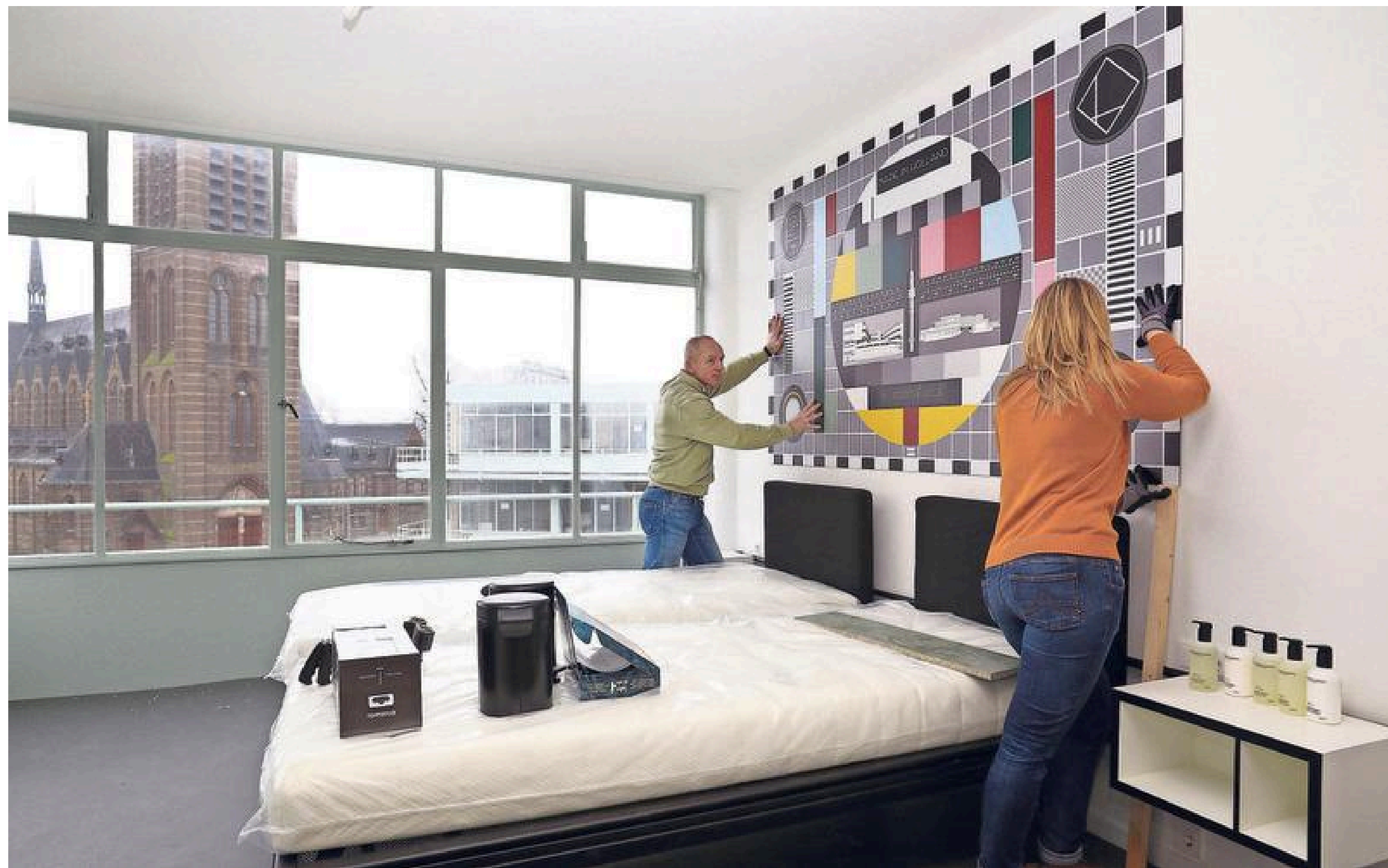
In het gerenoveerde Gooiland kunnen woensdag de eerste gasten weer slapen.