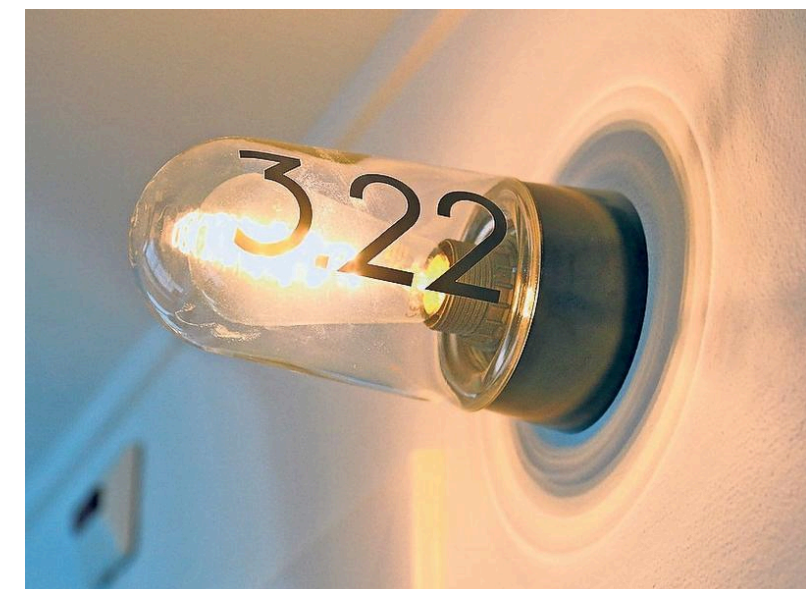
De kamernummers zijn verwerkt in 'radiolampen'.